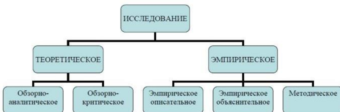
Рисунок 2 Классификация форм научного исследования

Схематически предложенные Б. Г. Ананьевым методы научного наблюдения личности представлены на рисунке 2 и в таблице 2.