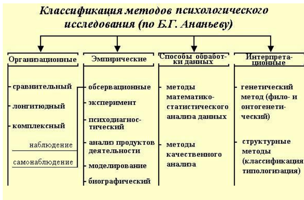
Рисунок 3. Классификация методов исследования

Отличие данных таблицы 2 от данных рисунка 3 заключаются в следующем: