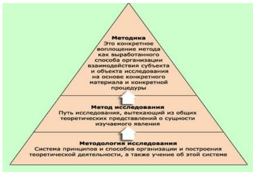
Рисунок 1. Определения и взаимосвязь основных категорий научного исследования в психологии и педагогике 9 .

Различные отрасли научной деятельности могут использовать свои, несколько отличающиеся от академических, определения. Рассматриваемые категории научного исследования, используемые в педагогике и психологии, приведены на рисунке 1.