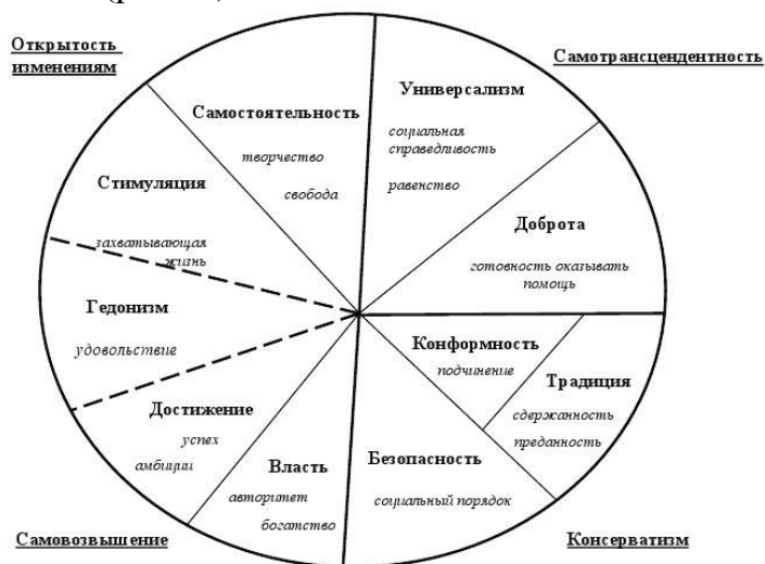
Рис. 6 Первичная оценка Личности пометодике Ш. Шварца 148

Первичное представление о Личности поможет составить тест ценности Шалом Шварца (Schwartz Shalom H.), разработанная в 1992 г. Она предназначена для измерения динамики ценностей в связи с изменениями в обществе, так и в связи с жизненными проблемами каждой личности. Под ценностями Ш. Шварц подразумевал «познанные потребности, непосредственно зависящие от культуры, среды, менталитета конкретного общества». В основе методики Ш. Шварца все ценности делятся на индивидуальные и социальные и их соотношение дает общую характеристику личности (рис.6.)