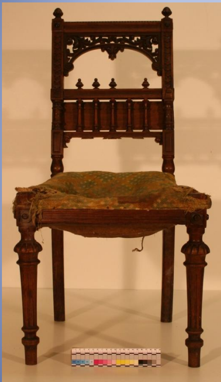
Памятник до реставрации

Студенческая работа по реставрации изделий из дерева (на примере орехового стула второй половины XIX века)