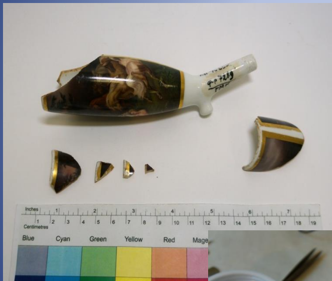
Общий вид до реставрации