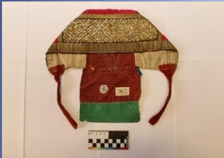
Вид памятника до реставрации

Студенческая работа по реставрации тканей (на примере головного убора XIX века из фондов Этнографического музея)