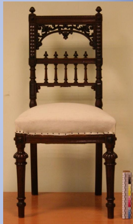
Памятник после реставрации