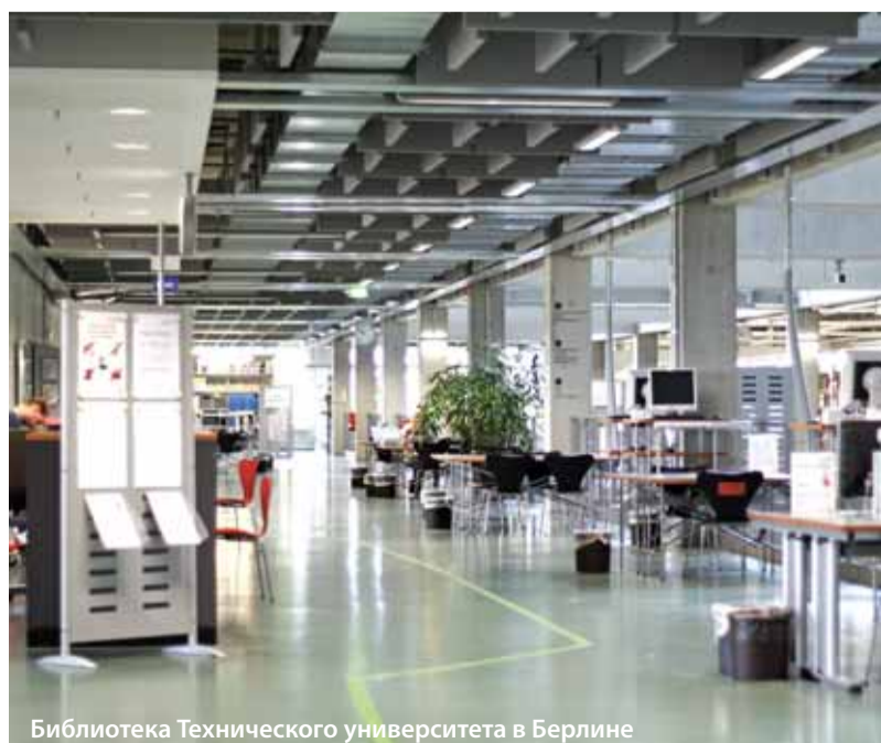
Библиотека Технического университета в Берлине