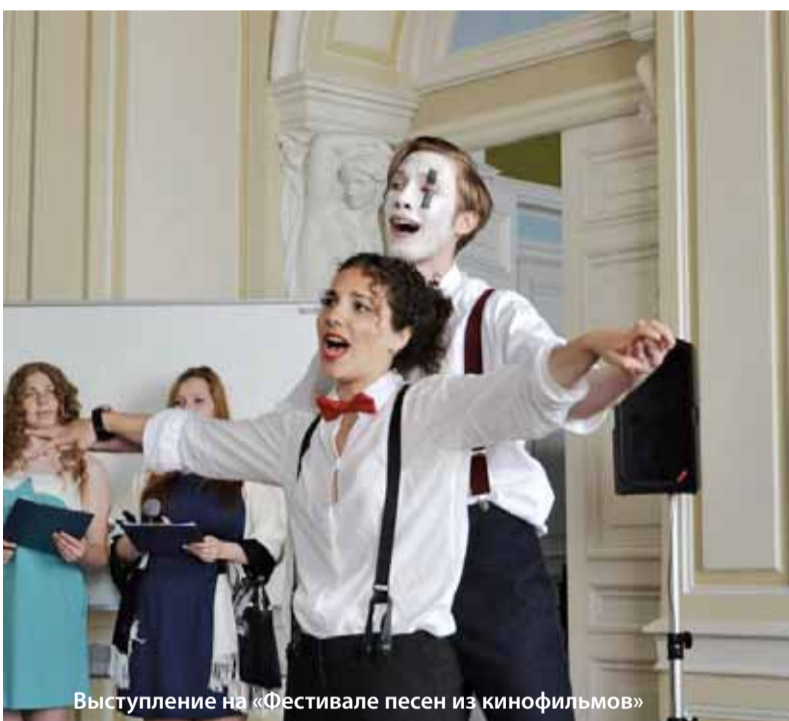
Выступление на «Фестивале песен из кинофильмов»

Традиционное выездное мероприятие второй год подряд прошло в пос. Токсово и не случайно – в