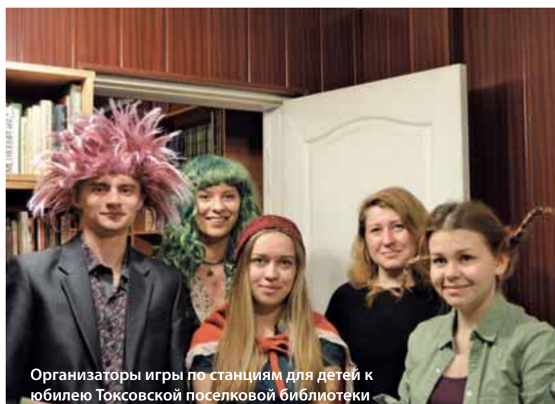
Организаторы игры по станциям для детей к юбилею Токсовской поселковой библиотеки