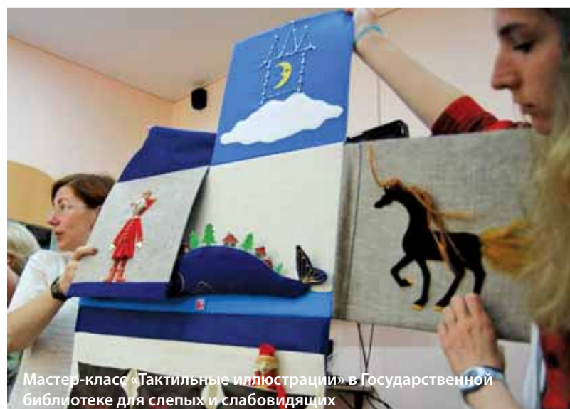
Мастер-класс «Тактильные иллюстрации» в Государственной библиотеке для слепых и слабовидящих

Следующий фестиваль станет юбилейным, нас ждёт ещё больше ярких мероприятий, знакомств с именитыми людьми и множество шансов проявить свои самые нестандартные таланты! До новых встреч!