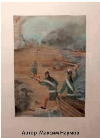
Автор Максим Наумов

Материал подготовлен редакцией «Газеты СПБГИК» и пресс-службой СПБРО РВИО