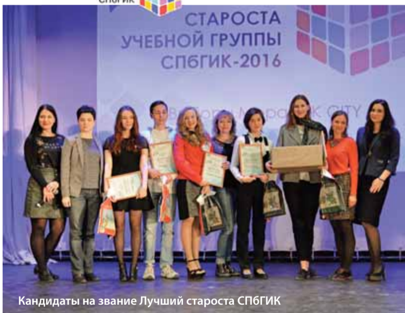
Кандидаты на звание Лучший староста СПБГИК

И вот что из этого вышло. Предвыборная кампания стала настоящим испытанием для наших старост. Тотальная проверка журналов, качество и аккуратность оценивались превыше всего. Следом – тест по Уставу нашего Института. Ведь кому-кому, а старостам необходимо знать, по каким законам править, как защищать студентов и наказывать провинившихся. Речь – главный инструмент политика: чем она грамотнее, а идеи кандидата яснее, тем больше голосов. То, что старосты владеют этим мастерством, подтвердили монологи, которые они