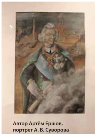
Автор Артём Ершов, портрет А. В. Суворова