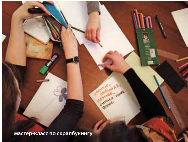
мастер-класс по скрапбукингу