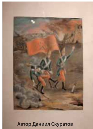
Автор Даниил Скуратов