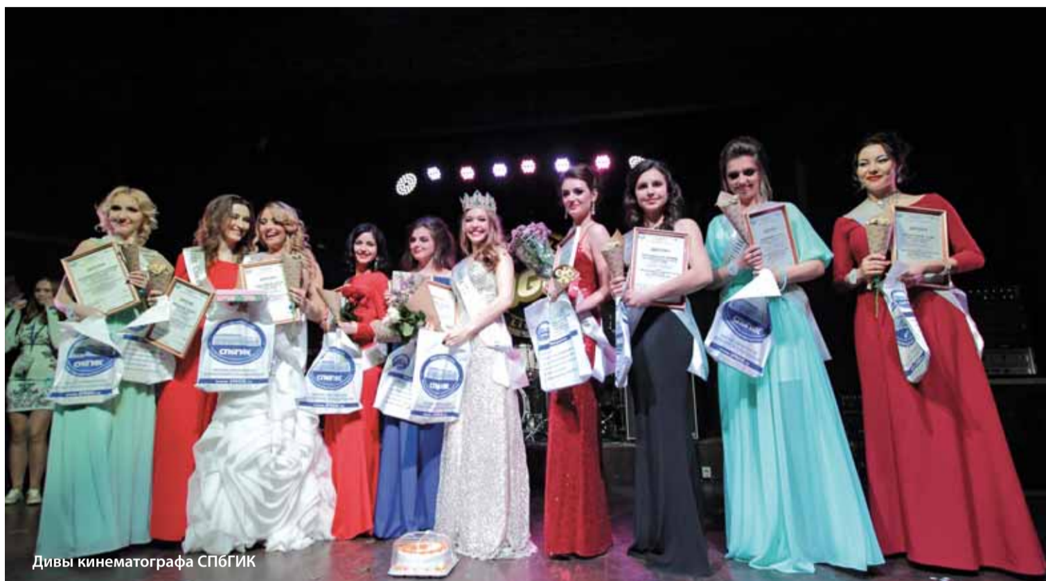
Дивы кинематографа СПБГИК