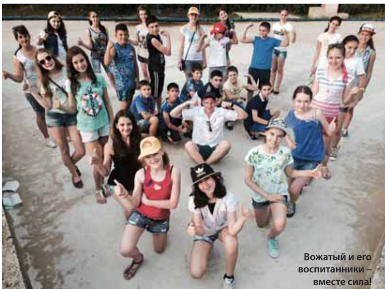
Вожатый и его воспитанники – вместе сила!

Первый отряд в количестве 21 человека провёл свои трудовые будни в качестве воспитателей во Всероссийском Детском Центре «Орлёнок» (под Туапсе). Ребята попали туда не случайно: каждый из них прошёл обучение в Школе вожатых СПбГИК «Команда Орлёнка». В течение летнего периода наши студенты зарекомендовали