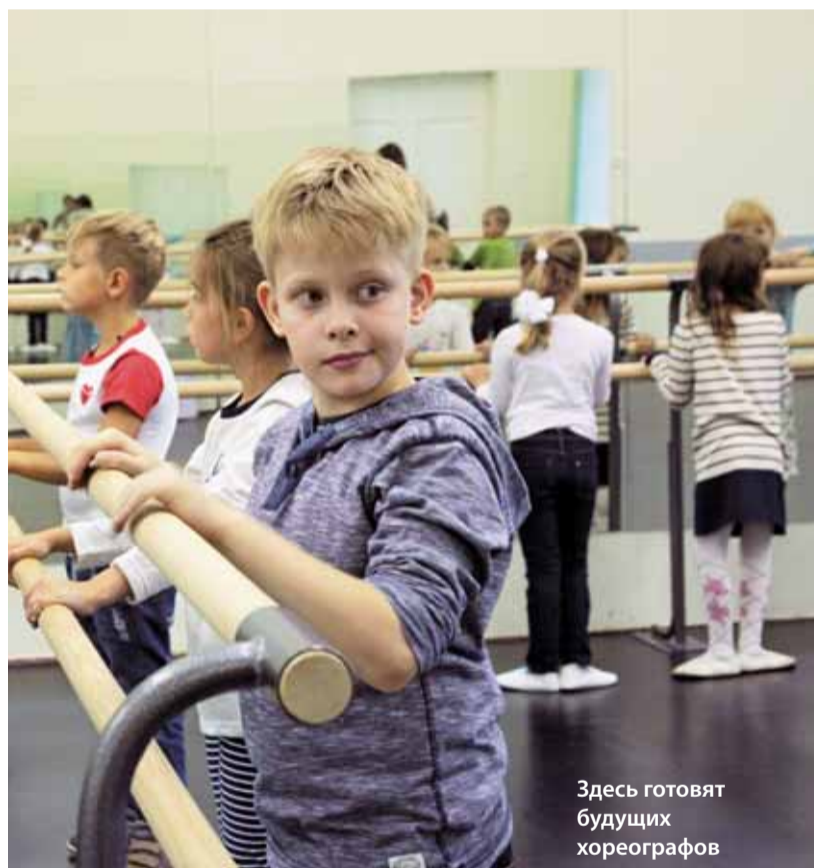
Здесь готовят будущих хореографов

Занятия в Школе искусств начнутся 1 октября. И тогда мы постепенно будем раскрывать для себя новые таланты и дарования.