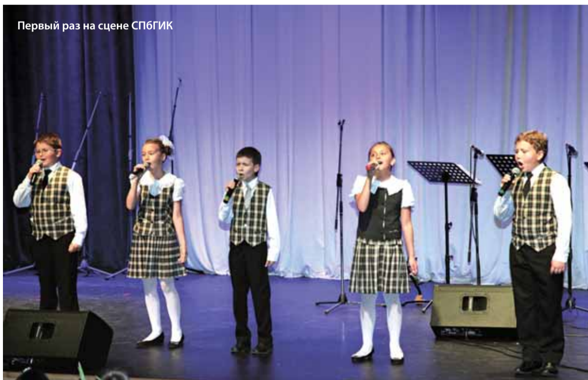
Первый раз на сцене СПБГИК