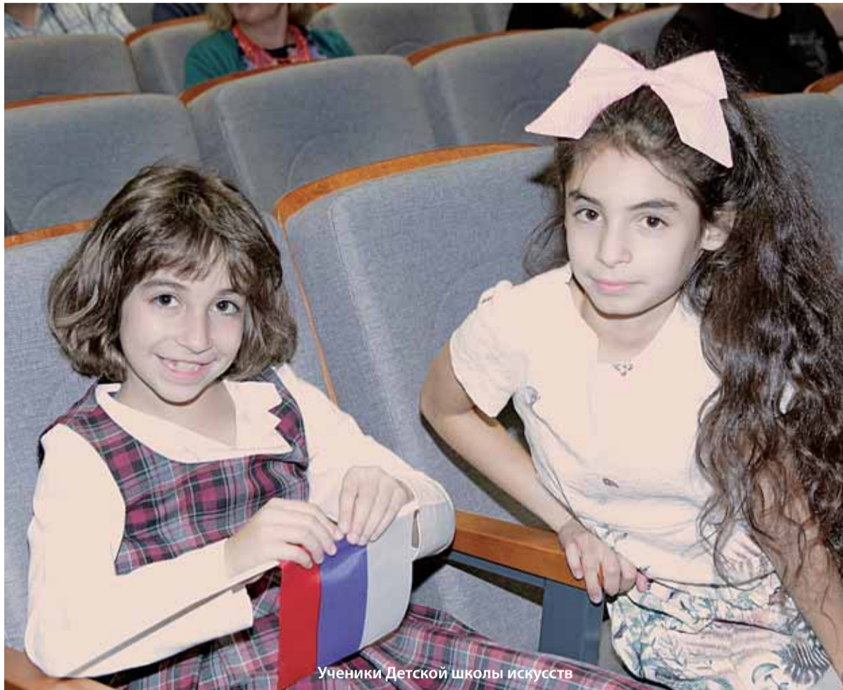
Ученики Детской школы искусств

Текст: Директор ДШИ СПБГИК М. Г. Рыбакова