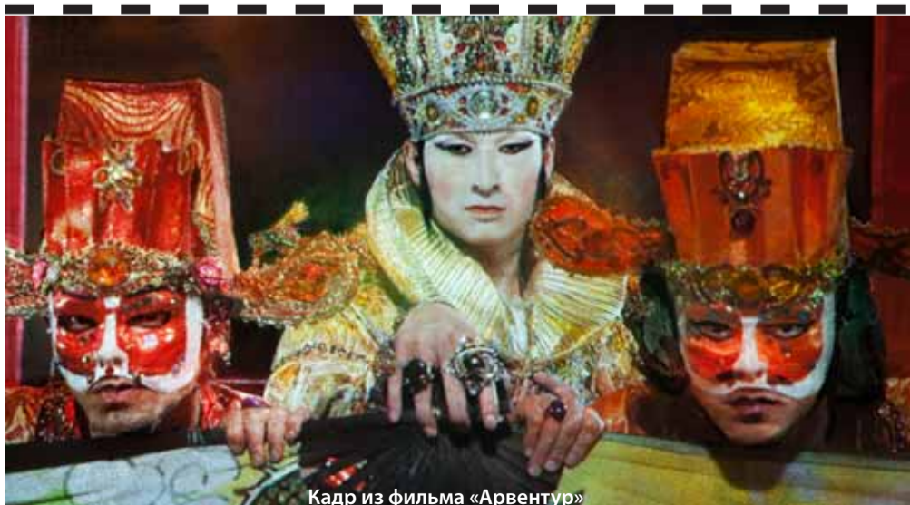
Кадр из фильма «Арвентур»