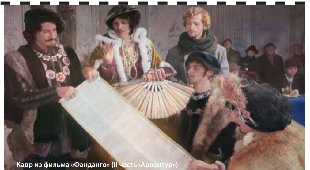
Кадр из фильма «Фанданго» (II часть «Арвентур»)